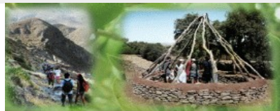
Campos de Trabajo 2015

Unos 180.000 jóvenes integran las asociaciones inscritas en este registro oficial del Instituto Andaluz de la Juventud (+)